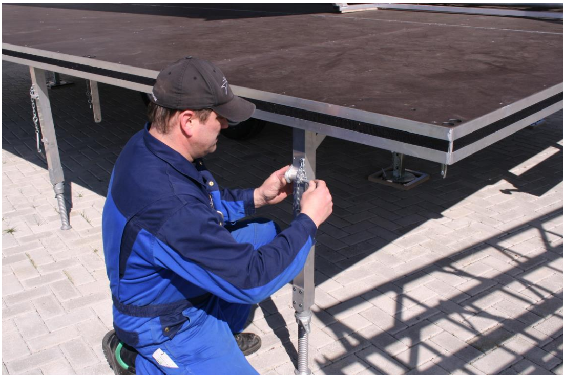
Bild 7 Bühnenstützen ausklappen, mit Bolzen sichern und Höheneinstellung vornehmen

Die Bühnenstützen vollständig ausklappen und mit dem Sicherungsbolzen sichern. Mit Hilfe der Gewindestücke an jeder Stütze, das jetzt ausgeklappte Bodenteil nach dem Mittelteil ausrichten und waagrecht stellen (Bild 7).