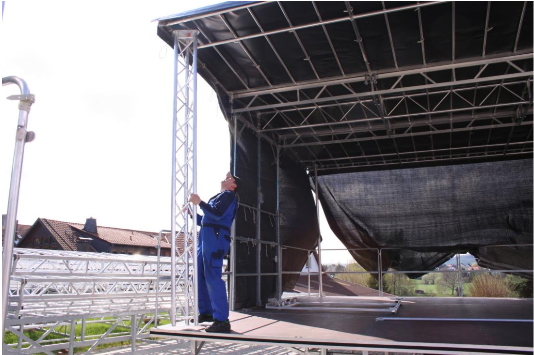
Bild 14 Stützen setzen und eindrehen