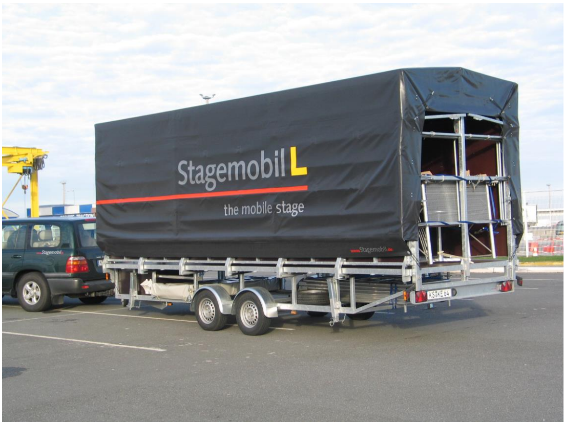
Aufbauanleitung Stagemobil L (Mobile Veranstaltungsbühne) Stand 01/2017 Stagemobil Eckart Fahrzeugbau GmbH, Bremer Landstraße 25, 34369 Hofgeismar-Hümme, Deutschland