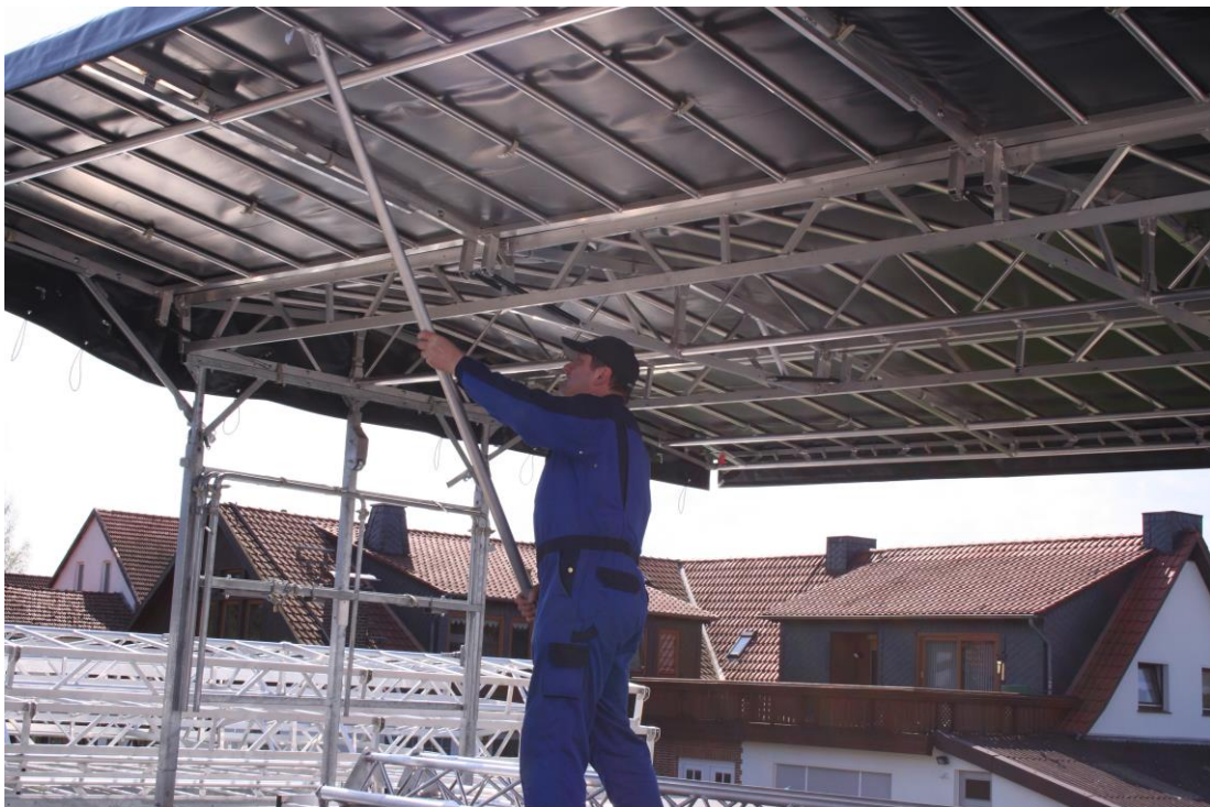
Bild 10 Dachflügel einrasten

Die Dachflügel werden mit Hilfe des Handling-Stabes in der gewünschten Position eingerastet (Bild 10) und mit Hilfe der grünen Bolzen gesichert (Bild 11).