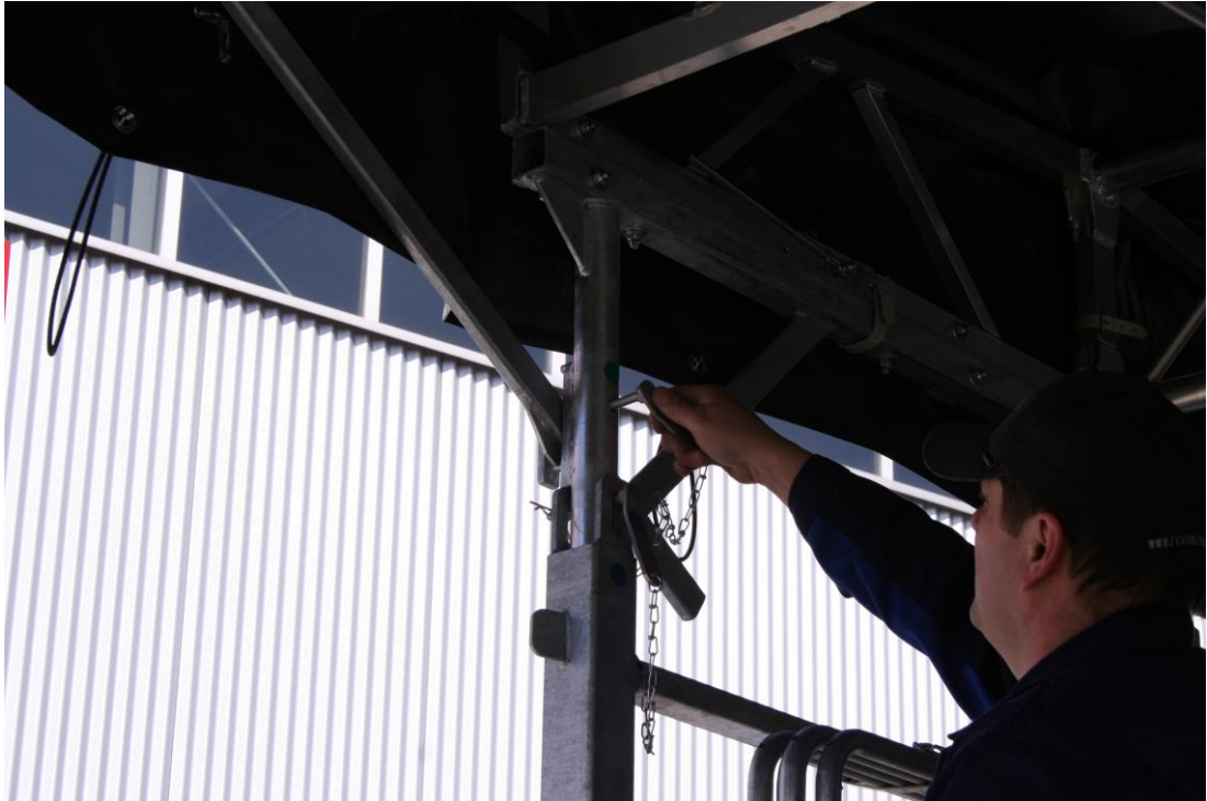
Bild 11 Dachflügel mit grünen Bolzen sichern