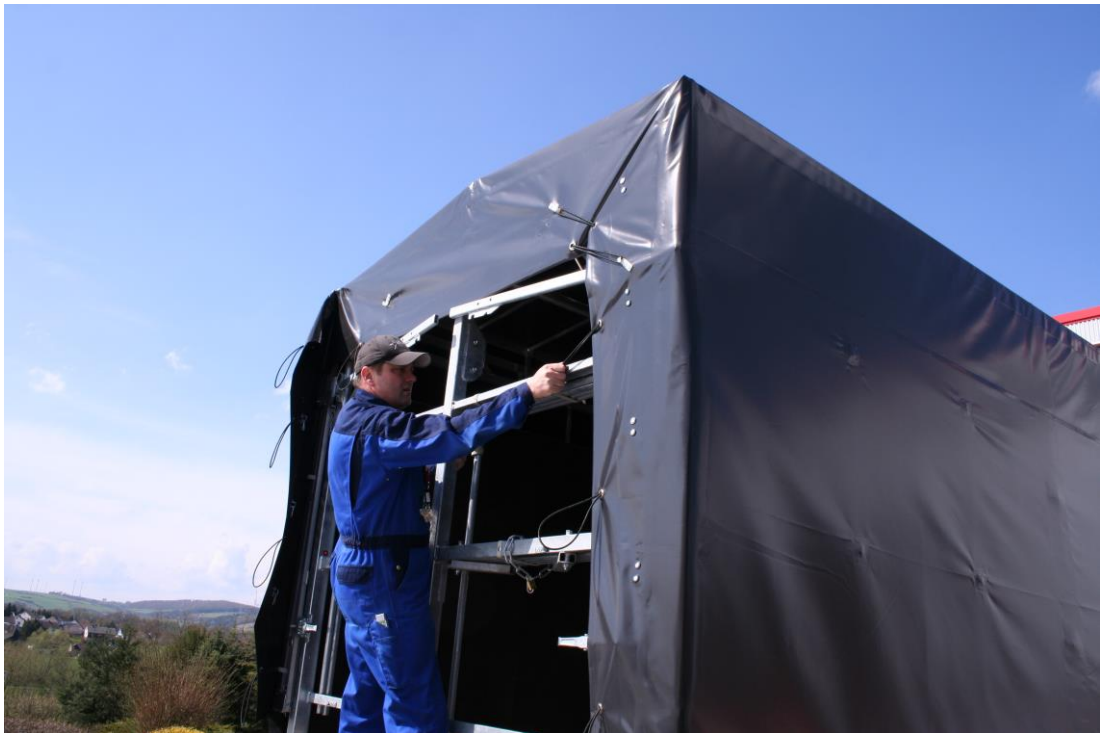
Bild 2 Planengummis lösen

An Vorder- und Rückseite des Anhängers sämtliche Planengummis lösen (Bild 2).