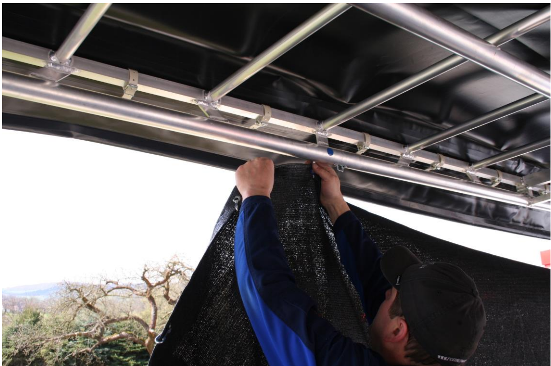
Bild 12 Befestigung der Behänge

Die Seiten- und Rückbehänge anhand der farblichen Markierungen in grün, blau und rot mit den Karabinern in den Halteösen einhängen. (Bild 12)