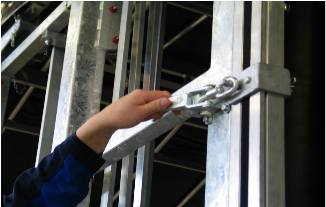
Bild 5 Handhebelverschlüsse öffnen