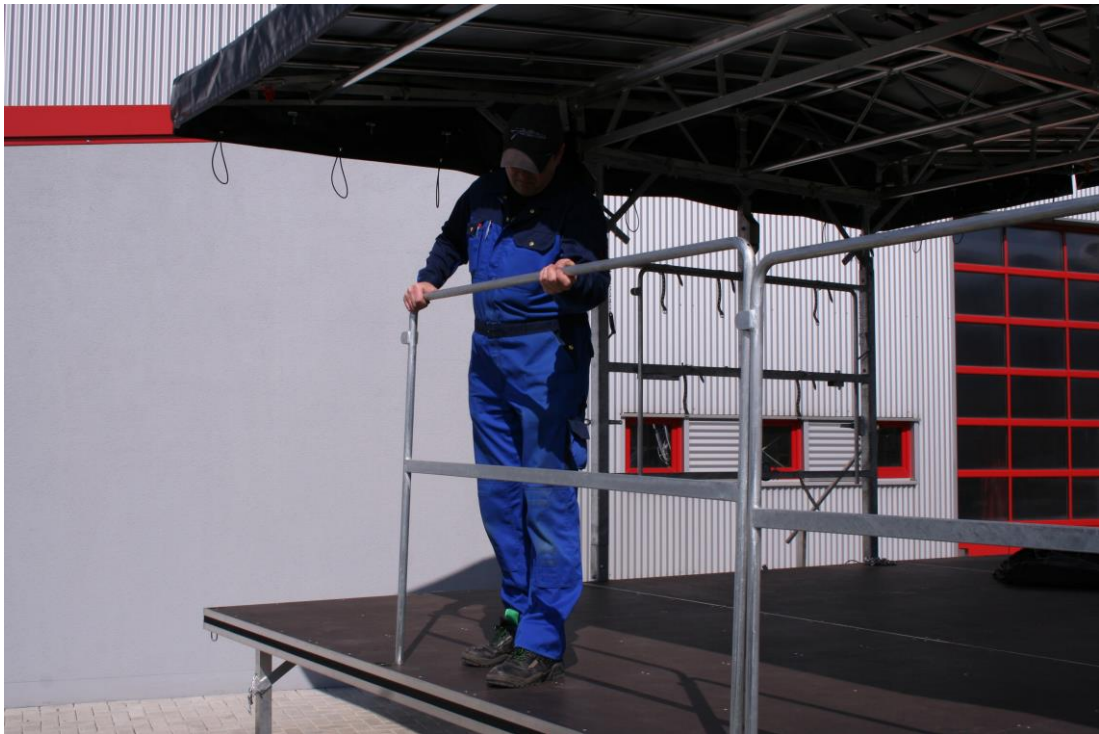
Bild 9 Geländer einstecken