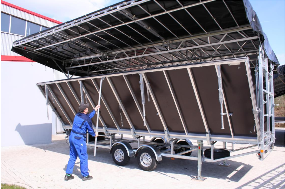
Bild 6 Bühnenboden aufklappen