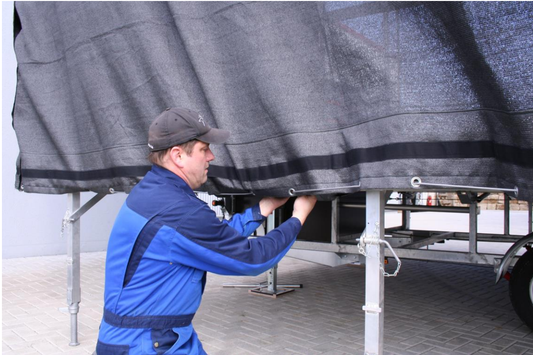
Bild 16 Einhängen der Behänge am Bodenteil

Seitenbehänge mit dem Rückbehang verbinden (Klettband) und anschl. Kordel unter dem Bodenteil bzw. an den Befestigungspunkten einhaken. (Bild 16)