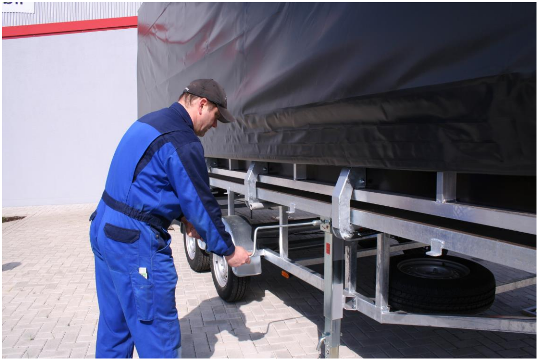
Bild 1 Hauptstützen ausfahren

Die 4 Hauptstützen für den groben Weg verbolzen, mit Hilfe des Kurbeltriebes an den Stützen den Anhängerboden mit Hilfe der Wasserwaage möglichst gerade stellen. (Bild 1)