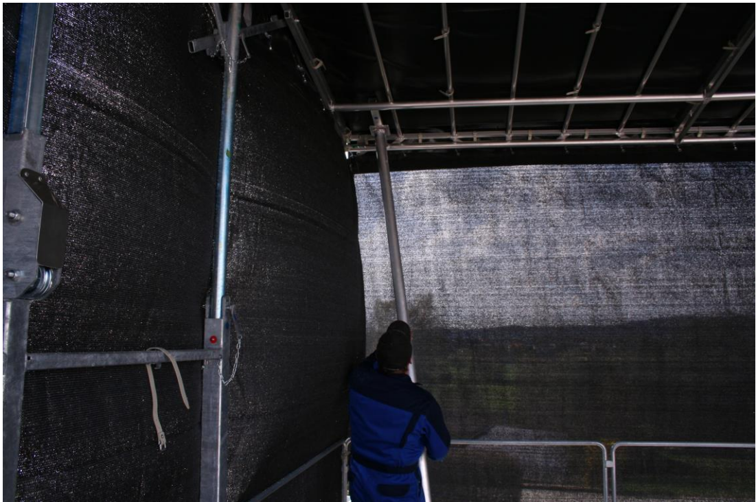
Bild 15 Setzen der hinteren Stützen