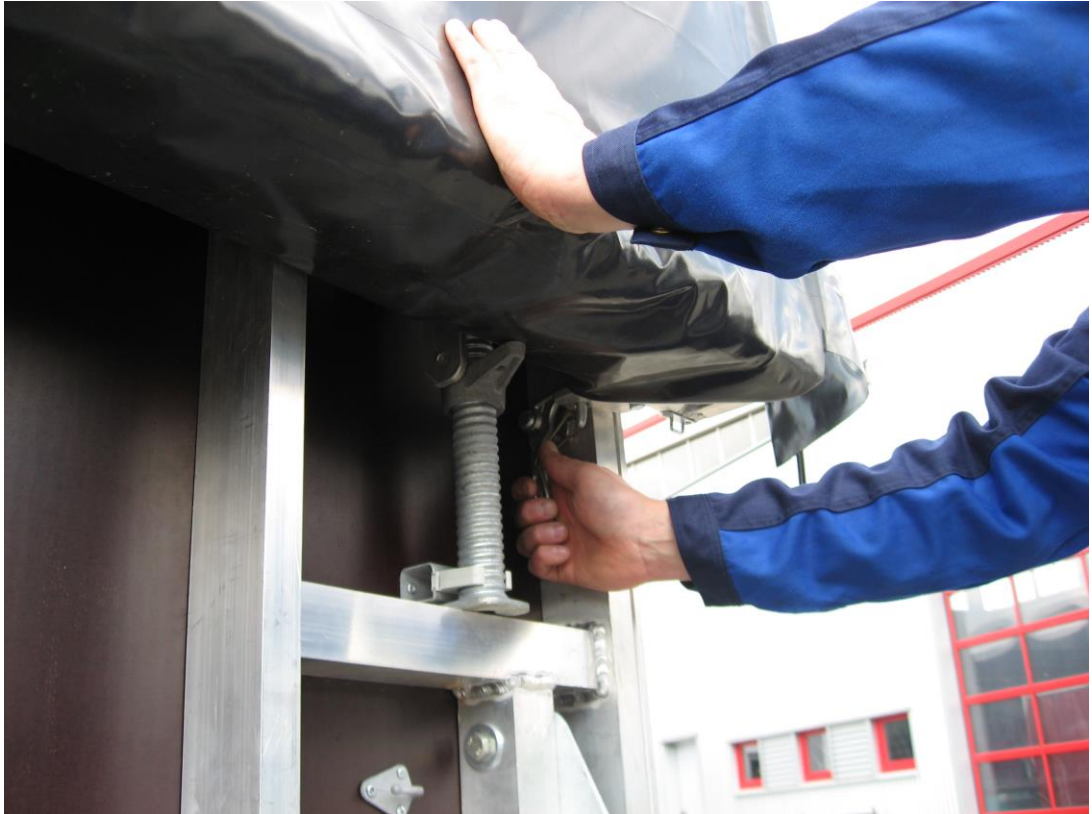
Bild 3 Winkelhebelverschlüsse des Daches öffnen