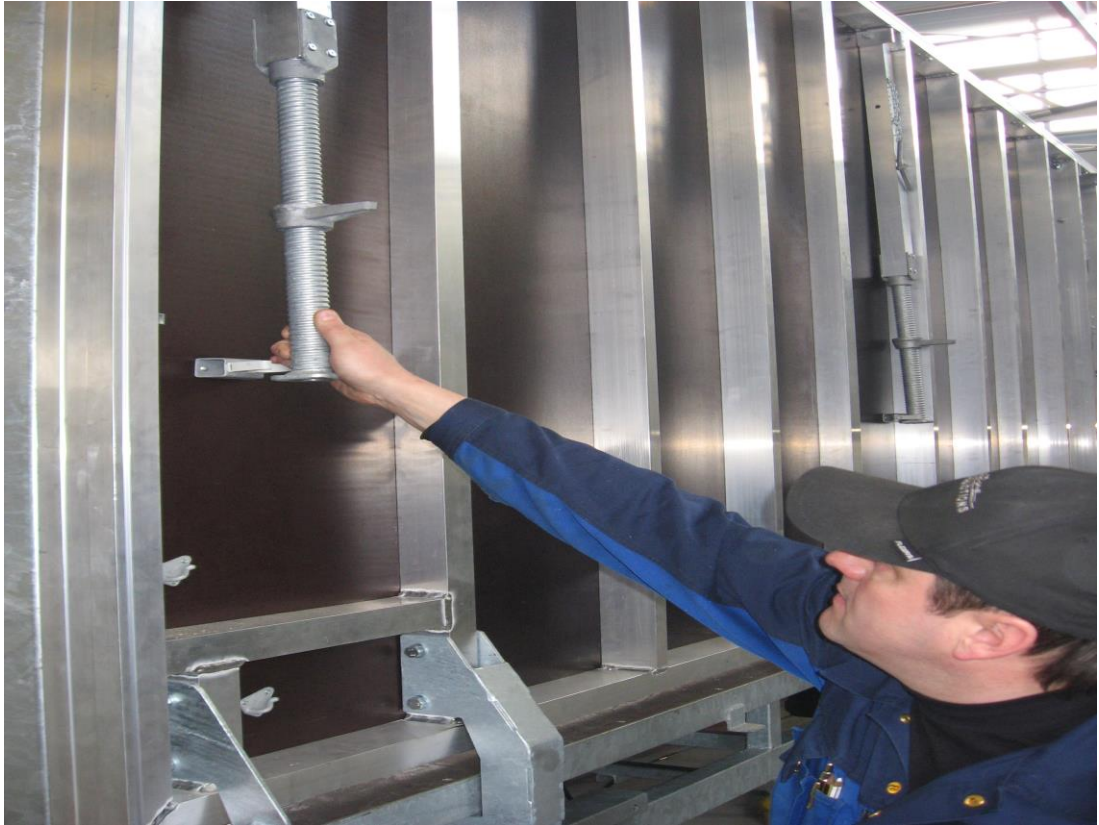
Bild 4 Bodenstützen lösen